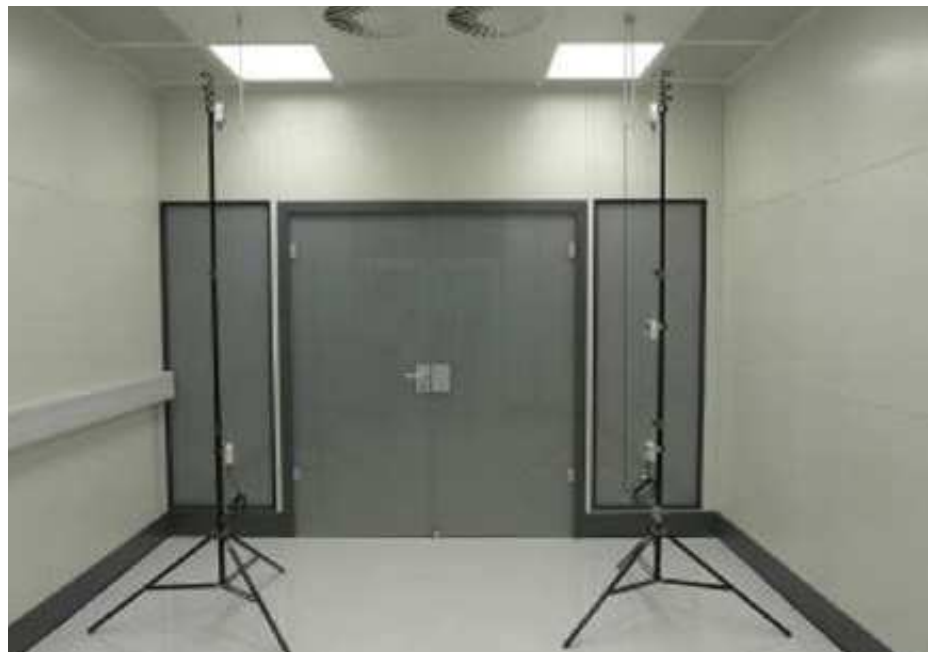
Der wesentliche Vorteil der Lampen für den Systemraumbau liegt darin, dass sie die Wärme nicht nach unten in den Raum, sondern nach oben abgeben, wo der Abluftstrom sie abtransportiert. Dadurch sind sie besonders gut für temperaturstabile Messräume geeignet.

Daher hat sich das Unternehmen entschieden, zusammen mit einem LED-Hersteller ein Lampenprogramm zu entwickeln, das bei den Formaten deutlich mehr Flexibilität erlaubt. „Maße von 312 x 625 mm bis 1250 x 625 mm sind nun problemlos möglich“, erklärt der Geschäftsführer. So kön-