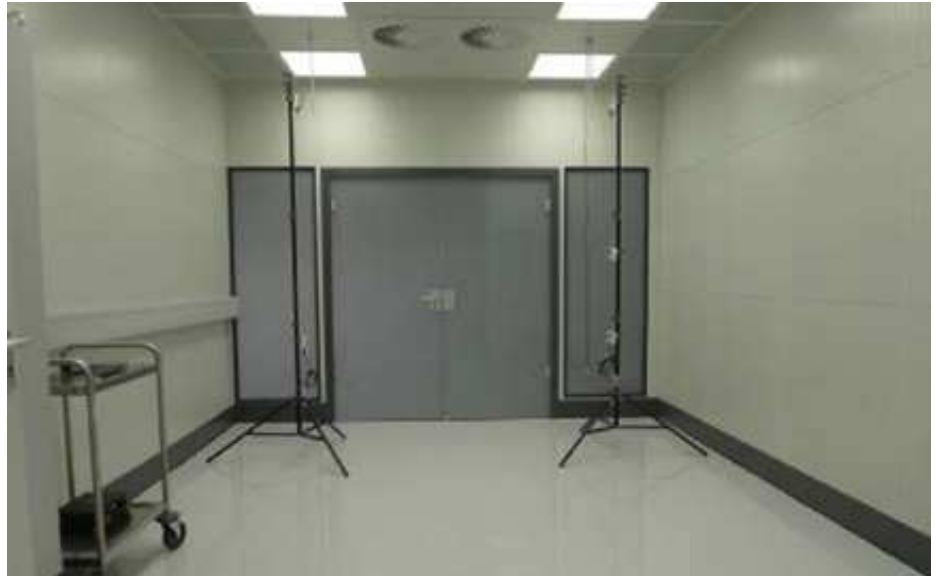
Im neuen Forschungslabor von Nerling sollen zukünftig die Auswirkungen von Störquellen in hochgenauen Räumen näher untersucht werden. Dazu wurden im Messraum der Güteklasse I erstmals die neuen, energiesparenden LED-Lampen eingebaut.

Insgesamt 8 LED-Leuchten sind im 17 m 2 großen Forschungsmessraum in Renningen verbaut. Die erreichte Beleuchtungsstärke der Lampen kann stufenlos zwischen 400 und 1.500 Lux eingestellt werden. „In der ersten Versuchsreihe soll die Frage beantwortet werden, wie die Spezifikationen der Güteklasse I gemäß VDI/VDE-Richtlinie 2627 zu erreichen sind“, so Nerling. Daneben sollen Tests zum Zusammenspiel der Leuchten und der weiteren klimatechnischen Komponenten durchgeführt werden: „Wir wollen beispielsweise die Frage beantworten, was im Raum passiert, wenn die LEDs gedimmt, die FFUs heruntergeregelt, nicht sauber temperierte Teile in den Raum eingebracht werden oder mehrere Personen auf einmal den Raum betreten“, erklärt Nerling. „Es gibt Raumkonzepte, die bei solchen Störungen zwei Klassen schlechter werden. Unser Ziel ist es, uns nur kurzzeitig und nur maximal um 1 Klasse zu verschlechtern.“